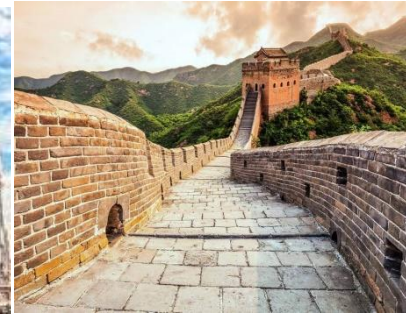
(die) Chinesische Mauer