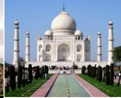
(das) Taj Mahal