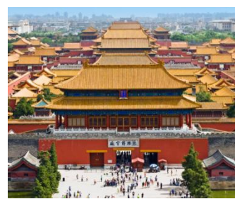
(die) Verbotene Stadt (Peking)