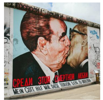
(die) Berliner Mauer