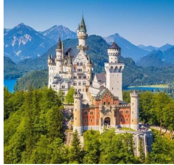
(das) Schloss Neuschwanstein