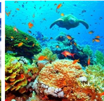
(das) Great Barrier Reef