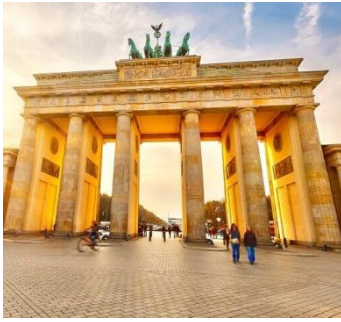
(das) Brandenburger Tor