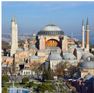
(die) Hagia Sophia