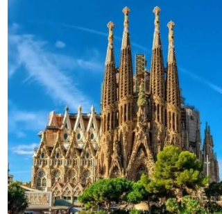
(die) Sagrada Familia