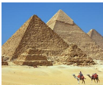
(die) Pyramiden von Gizeh