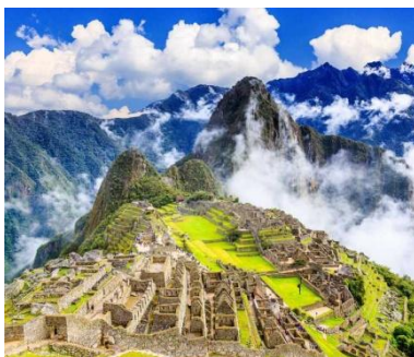
(die alte Inka-Stadt) Machu Picchu