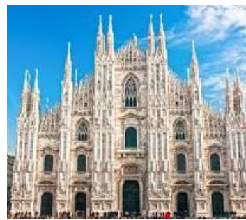
(der) Mailänder Dom