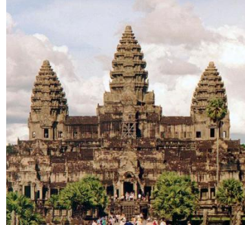
Tempelanlage Angkor Wat