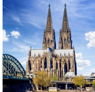
(der) Kölner Dom